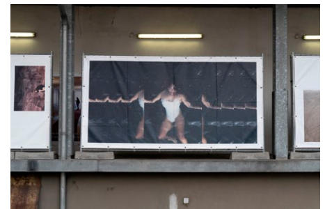
oben: What is human honey? , Ausstellungsansicht